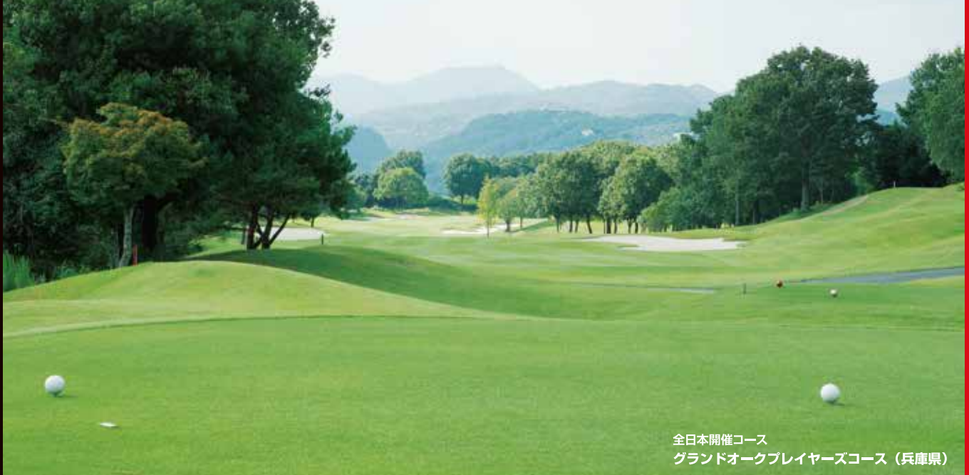
全日本開催コース グランドオークプレイヤーズコース(兵庫県)